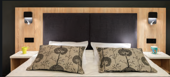
■ LARGEUR 2300 ■ LARGEUR 2600