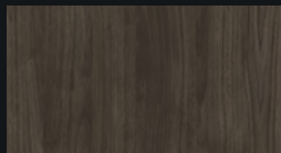
CHÊNE FONCÉ D4409