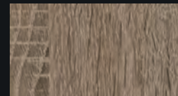
CHÊNE TRUFFE D5194